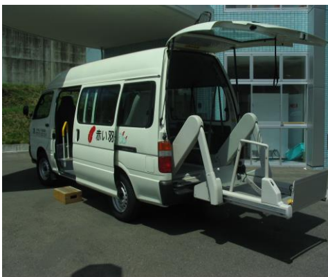
当施設車椅子リフト車

協力病院まで施設の車で送迎しますので安心です。 ※他の医療機関受診の時等は、ご家族様に御相談する場合があります。