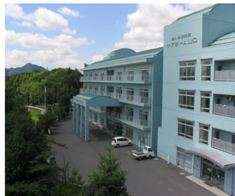
隣接の山口平成病院