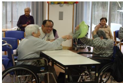
レクリエーション風景